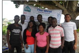
The Meal in Benin, September 15th