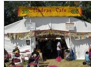
Madras Café, UK, July