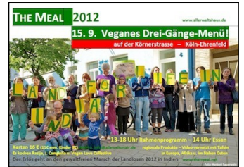
The Meal in Germany, September 15th