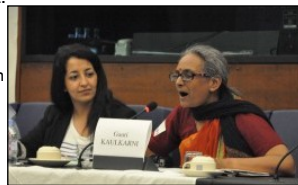
Conference at European Parliament, May