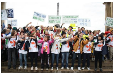
March Le Croisic-Paris, France, October