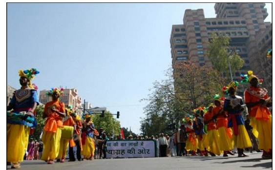
March to the Parliament, Chetawani Rally, Delhi, March 7th, 2011