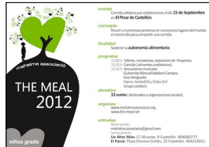
The Meal in Spain, September 15th

« If you are not indifferent, the world will be different ». The appeal of P.V. Rajagopal has been largely heard ! Thank you !