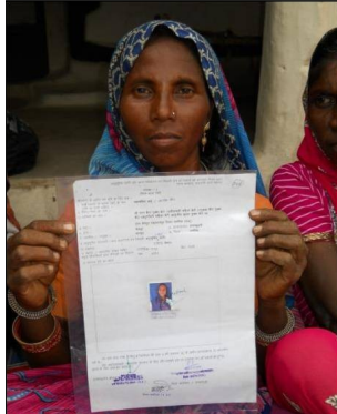
A woman showing her land title, Ummaria dist, M.P., Nov. 2010.

Janadesh Chetawani Yatra (Marcha de advertencia). En el 2006, Ekta Parishad amplió su acción, pasando de campañas estatales a nacionales. El objetivo era el de plantearle al gobierno central el problema de la falta de tierras. En octubre de 2006, 500 líderes de Ekta Parishad marcharon de Gwalior a Delhi para advertirle al gobierno que si éste no hacía nada, 25.000 personas irían a Delhi el año siguiente.