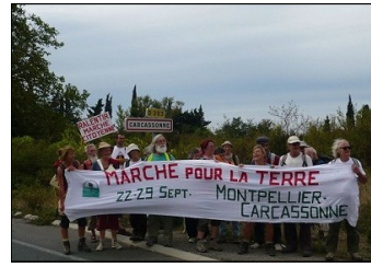
March Montpellier-Carcassonne, France, Sept.