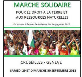
March Cruseilles-Geneva, Switzerland, September