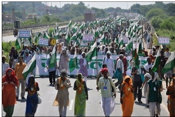
March Jan Satyagraha 2012, October 2012.

Jan Satyagraha (La gente anhela la verdad). Durante y después de la Jan Samwad Yatra, el Gobierno central mostró una voluntad de negociación con Ekta Parishad y las organizaciones asociadas a la Jan Satyagraha. A finales de septiembre de 2012, se celebraron varias reuniones con el Ministro de Desarrollo Rural, el Primer Ministro de India, los ministros estatales de hacienda, etc. Un acuerdo iría a ser firmado el 2 de octubre de 2012, día de inicio de Jan Satyagraha, pero finalmente el gobierno se retractó, firmando un documento en el que se negaba a comprometerse. El 3 de octubre de 2012,