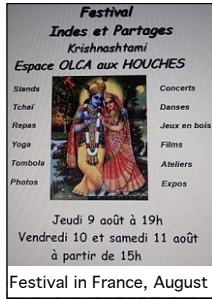
Festival in France, August

El éxito de Jan Satyagraha se debe a la fuerza de los pobres y marginados de India, quienes prepararon y llevaron a cabo la marcha de Gwalior a Agra. También se debe a la fuerza de la juventud, que tuvo un papel muy importante en el proceso, y con la fuerza de la no-violencia, que es la base de la movilización. Hay otro elemento que debemos mencionar: la fuerza de la solidaridad. En India y en el mundo, miles de personas levantaron la voz y actuaron en apoyo a la marcha. Muchos activistas promocionaron la Jan Satyagraha en foros, festivales y reuniones. Recaudaron fondos, alertaron a la opinión pública, a las autoridades y los medios de comunicación. En Europa, más de 20 marchas se organizaron este año. El 15 de septiembre, "The Meal" reunió a cientos de personas en 33 ciudades de Asia, África, Oriente Medio y Europa. Varios artistas (fotógrafos, pintores, músicos ...) utilizaron sus talentos para dar a conocer la marcha a través de exposiciones y conciertos. Esta gran movilización fue un gran apoyo para los manifestantes de India, y participaron del éxito de Jan Satyagraha.