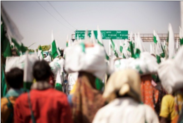
Marcha Jan Satyagraha, Madhya Pradesh, 3 de octubre 2012

Al amanecer, la Ground Mela estaba llena de actividad. Cada grupo de Satyagrahis (75 grupos) se preparaban para comenzar la jornada. Ya que se suponía que la marcha debía comenzar el día anterior, los manifestantes tuvieron que caminar 22 km, bajo un sol inclemente, hasta a Muradabad el lugar previsto para acampar. Algunos de los participantes de la Jan Satyagraha se quedaron en la plaza para dejar todo en orden.