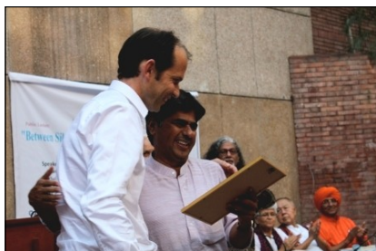
Silvan Fedier, de la Sociedad Internacional de Derechos Humanos entregó el premio a los Derechos Humanos 2012 a PV Rajagopal, Delhi, 29 de septiembre. 2012

Durante el evento, la sección suiza de la Sociedad Internacional de Derechos Humanos entregó el premio a los Derechos Humanos 2012 otorgado a PV Rajagopal, "en reconocimiento por su compromiso dedicado y su acción no-violenta en favor de las personas más desfavorecidas de India.