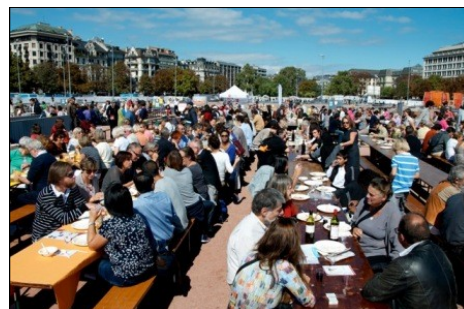
The Meal en Ginebra, 15 de septiembre 2012