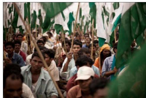
Los satyagrahis al Mela Ground, Gwalior, 2 de octubre 2012

Tras el discurso de Jairam Ramesh, representantes de Ekta Parishad y otras organizaciones que apoyan Jan Satyagraha se reunieron para decidir cómo responder a la propuesta del Gobierno. Una hora más tarde, PV Rajagopal regresó al escenario y manifestó su decepción por las vagas declaraciones del gobierno que no coincidía con el plan de trabajo discutido durante las negociaciones preliminares. Claramente habían dificultades para dar inicio a la marcha, ya que la comida es limitada y solo alcanza para alimentar a la gente durante 10 días. Donaciones adicionales tendrán que ser recogidas. A pesar de estos obstáculos, la gente ha decidido marchar hasta Delhi. Ante este dilema, PV Rajagopal pidió a la gente levantar sus banderas, si estaban a favor de mantener la marcha como se había planeado inicialmente. Inmediatamente un mar de banderas verdes y blancas invadió el cielo. El veredicto fue claro: Jan Satyagraha se pondrá en marcha; los manifestantes iniciarán su ruta hacia Delhi mañana 3 de octubre a las 7:30 de la mañana.