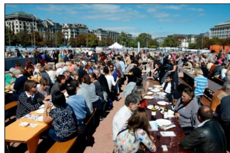
The Meal à Genève, 15 septembre 2012