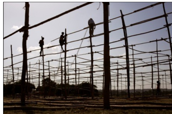
Des ouvriers préparent le Mela Ground, Gwalior, 30 sept. 2012