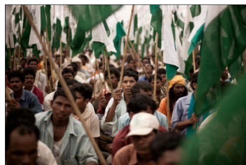
Les satyagrahis au Mela Ground, Gwalior, 2 octobre 2012

Suite au discours de Jairam Ramesh, les représentants d'Ekta Parishad et d'autres organisations soutenant Jan Satyagraha se sont réunis pour décider de la réponse à apporter aux offres du gouvernement. A peine une heure après, PV Rajagopal est revenu sur la scène, pour communiquer leur déception suite aux vagues déclarations du gouvernement, qui ne suivaient en rien la feuille de route discutée pendant les négociations préalables. Il y avait clairement des problèmes pour décider du maintien de la marche, dans la mesure où la nourriture est limitée et ne suffit à ce stade que pour nourrir les gens pendant 10 jours. De nouveaux dons devront être récoltés. Face à ce dilemme, PV Rajagopal a demandé aux gens de hisser leurs drapeaux s'ils étaient en faveur de la tenue de la marche comme prévu initialement. Un océan de drapeaux verts et blancs a immédiatement envahi le ciel. Le verdict était clair. Jan Satyagraha se mettra en route ; les marcheurs entameront le chemin vers Delhi le lendemain à 7h, le 3 octobre.